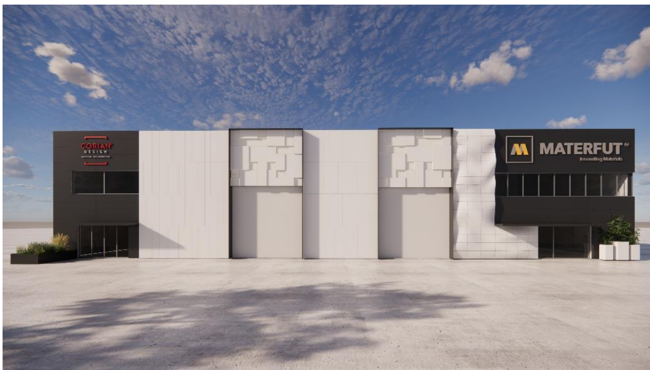
Sede centrale di Materfut®, Portogallo. La facciata con pannelli Corian® Exteriors (realizzati con Corian® Solid Surface) presenta diverse possibilità di modellatura, tra cui pannelli di forma tridimensionale, creati con design parametrico; design dell'architetto Alexandre Sousa Lopes; produzione e installazione di Materfut®; immagine di Materfut®, tutti i diritti riservati.

La parete Linea Pannelli e la facciata Materfut® sono state accolte con grande entusiasmo da architetti e designer, che vedono aprirsi un nuovo mondo di possibilità progettuali grazie all'utilizzo della nuova tecnologia sviluppata da Corian® Design. Le possibilità diventano praticamente infinite e permettono la realizzazione di progetti sempre più personalizzati.