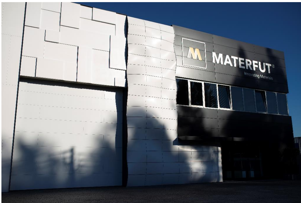
Sede di Materfut®, in Portogallo. La facciata con pannelli in Corian® Exteriors (realizzati con Corian® Solid Surface) presenta diverse possibilità di sagomatura, inclusi pannelli di forma organica creati con design parametrico; Progetto dell'architetto Alexandre Sousa Lopes; fabbricazione e installazione di Materfut®

Gli edifici odierni sono pensati come spazi multifunzionali. La loro realizzazione crea complessità progettuali per gli architetti a cui si aggiungono quelle legate alla ricerca di soluzioni eco-compatibili. Le nuove sedi aziendali, ad esempio, devono ricoprire vari ruoli oltre allo svolgimento di lavoro d'ufficio. Per rispondere a queste nuove sfide, gli architetti utilizzano sempre di più l'intelligenza artificiale.